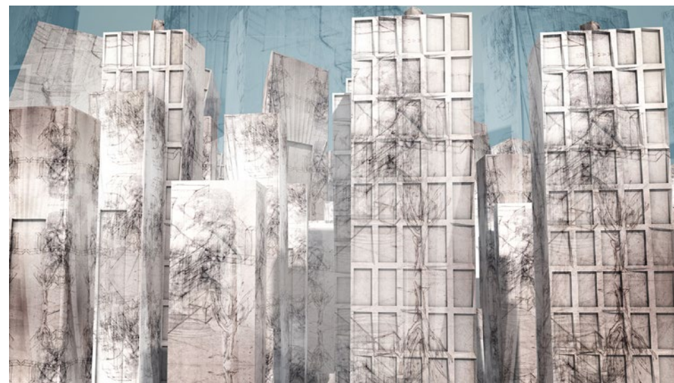
cikel Sledi organskega , digitalna grafika, 50 x 70 cm, 2021.